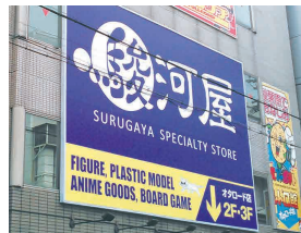
▲ 駿河屋日本橋オタロード店