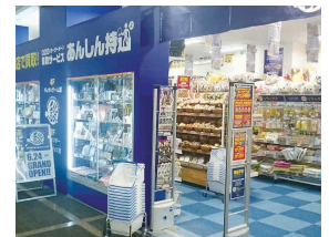
▲ 駿河屋小倉あるあるCity店